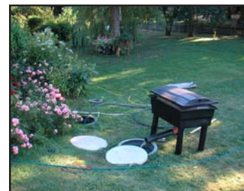
Produkten levereras i färgen grön.