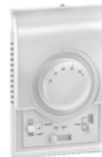
Väggtermostat AC, 3-steps