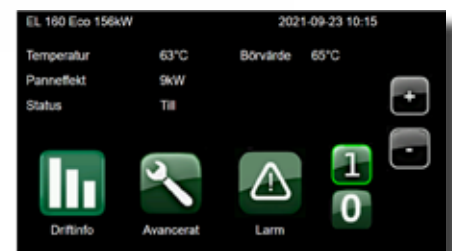
Pekskärm i Eco-serien (exempel)